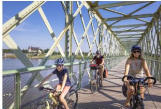
La Loire à Vélo à Sully-sur-Loire.